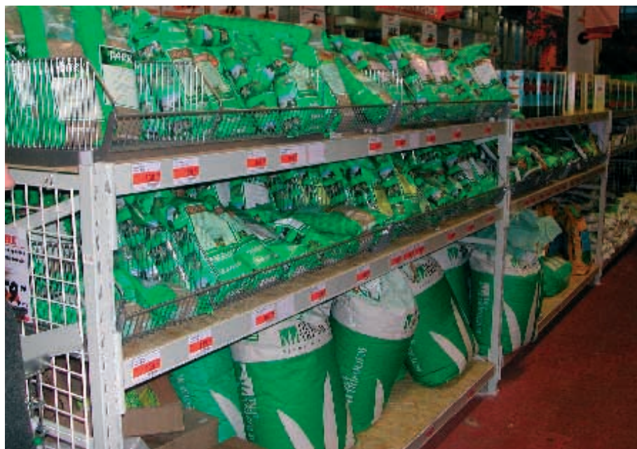
DLF-TRIFOLIUM frø på hylderne i OBI Hypermarket i Moskva.

Der er meget at fortælle om Rusland og Moskva. Det virker tit som om, Rusland er langt væk, men faktisk er der "kun" 2 1/2 times flyvning til Moskva fra København - mentalt virker denne afstand ofte meget længere.