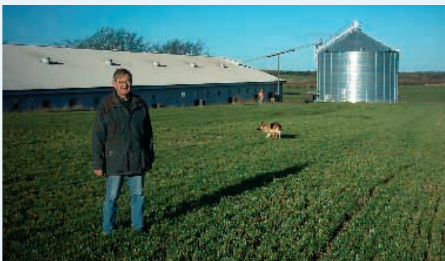
Veletableret udlæg af alm. rajgræs, Foxtrot.