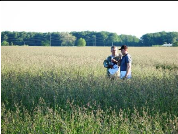
Hundegræs Amba i fuld flor