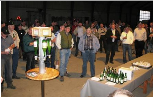
Deltagerne lytter opmærksomt