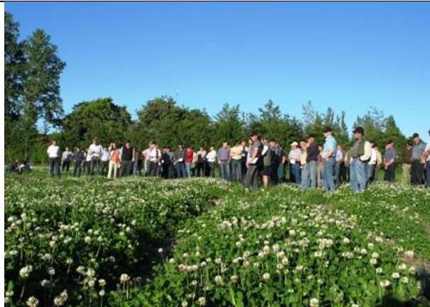
Bierne summede stadig i hvidkløveren kl. 20