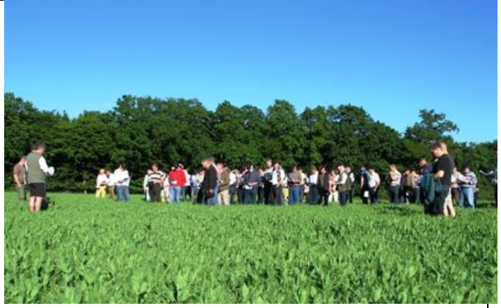
Knap 100 deltagere deltog i markvandringen