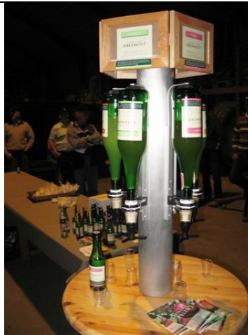
Efter markvandringen var der smagsprøver på æblemost