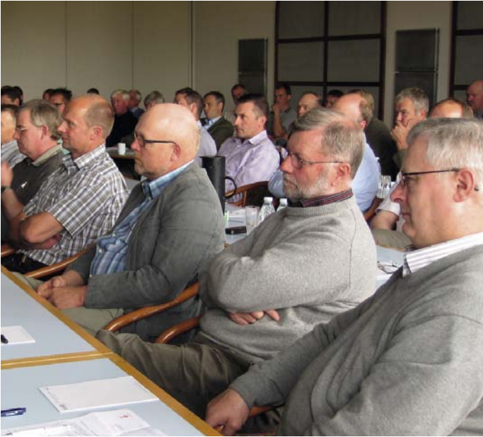
Delegerede øst for Storebælt under regionsmødet den 8. juni på Hotel Hvide Hus, Køge