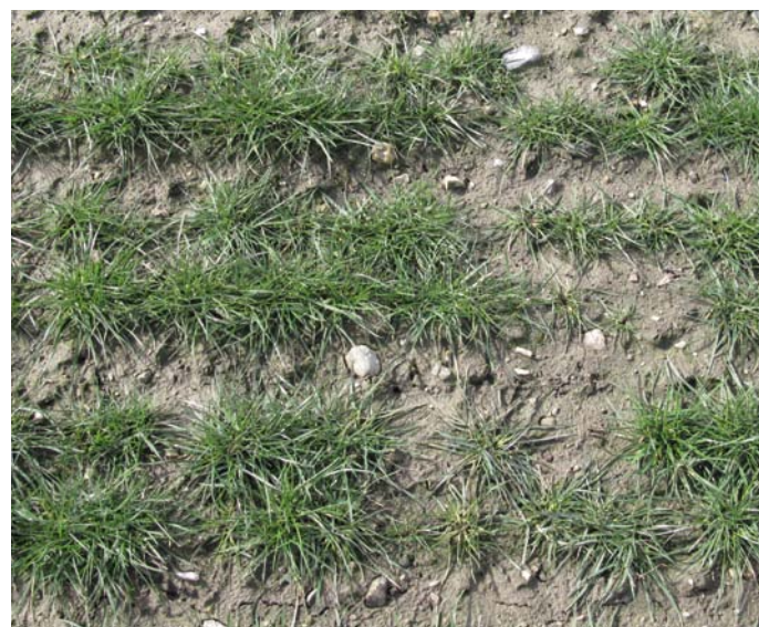
Almindelig rajgræs Neruda plænesort sået efterår 2008 og behandlet med Oxitril og DFF efterår mod tokimbladet ukrudt og enårig rapgræs. Billedet er taget forår 2009. Udbytte 2009: 1500 kg/ha

I de senere år har vi set gode resultater af forskellige græsmidler anvendt i efteråret. Der er opnået en del off-label godkendelser, så der er gode muligheder for at holde markerne rene for tokimbladet ukrudt og græsukrudt. Enårig rapgræs bekæmpes med DFF og/eller Stomp, og vindaks med Boxer. Tokimbladet ukrudt bekæmpes med Oxitril og /eller Express. Nærmere detaljer om dette udsendes i FrøavlsINFO. Specielt græsmidternes virkning er meget afhængig af korrekt tidspunkt og jordfugtighed.