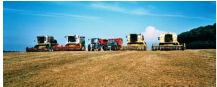
Tærskelholdet med 4 mejetærskere klar til at rykke ud

"I en frøafgrøde står der alt for meget på spil, hvis høsten ikke håndteres rettidigt. Derfor har vi et tærskelhold, hvor aftaler med naboer betyder, at der måske er fire mejetærskere i gang i samme mark. Det betyder, at vi kan høste færdigt på højst 2 dage. Jeg plejer at sige: En sort til en dag. Det hele skal gå op i en højere en-