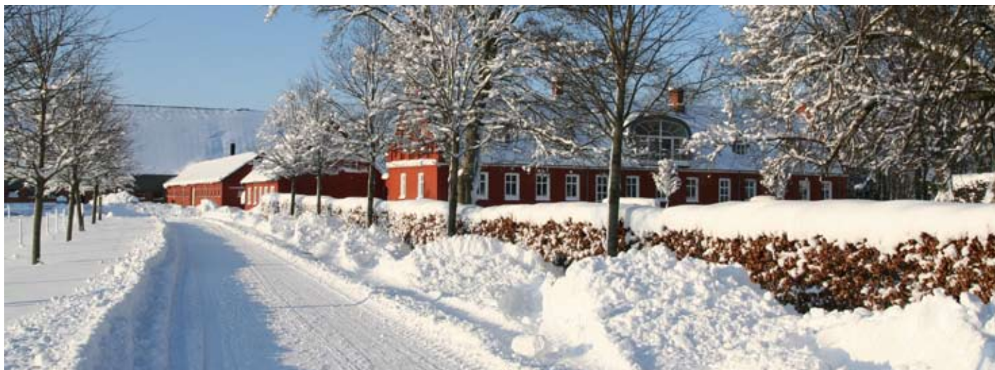
Indkørsel til Torsmark