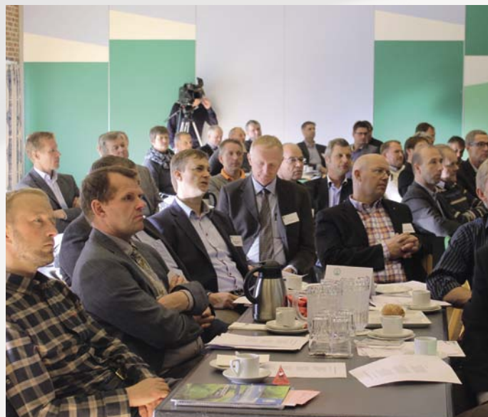
Delegerede fra Nordøstjylland

Jeg vil afrunde denne første del af beretningen med at sige tak. Tak til DLFs 670 medarbejdere for en markant og professionel indsats endnu engang. I står – fra ledelse til lager – bag indsatsen i 70 lande udover verden. I besidder, hver på jeres felt, en unik viden