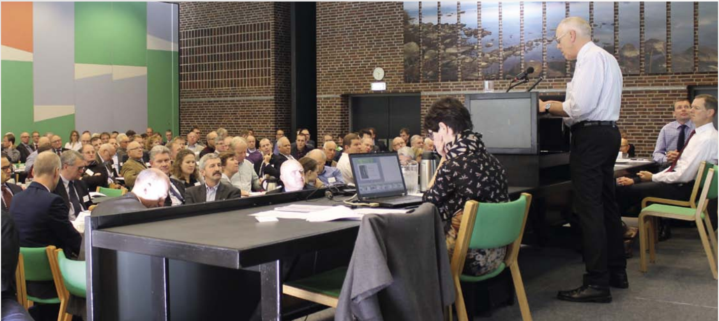
DLFs generalforsamling 2013

Bestyrelsen stiller forslag om, at der fra ekstra reservefond, altså ikke-fordelt egenkapital, overføres otte millioner kroner til driftsfonden, som herefter vil være på 145 millioner kroner, eller 17 pct. af egenkapitalen.