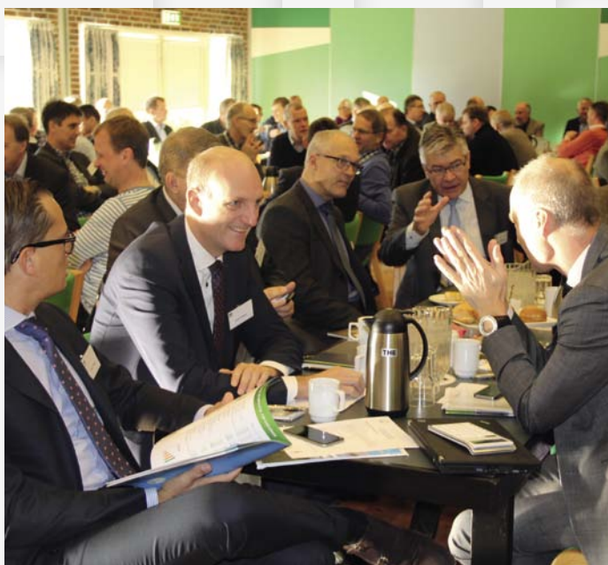
Medarbejdere, gæster og avlere i god debat, før generalforsamlingen gik i gang

” Vi har store forventninger til, at de danske politikere begynder at levere fornuftige rammevilkår ”