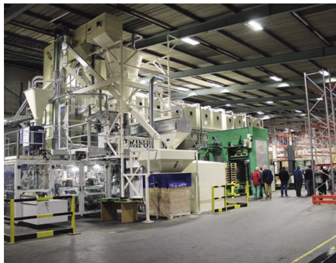
Der går 12 minutter, fra ordren er modtaget, til den er blandet og færdigpakket på det nye superanlæg