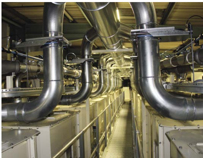
Frøtransporten til hver enkelt af de 48 renvaresiloer sker med luft

DLF-TRIFOLIUM indviede i november et topmoderne blandingsanlæg lige udenfor Edinburgh, der er klar til at forsyne England, Wales, Skotland og Nordirland med frøblandinger til landbruget. Anlægget er den største investering af sin art i Storbritannien med kapacitet til at levere halvdelen af landbrugets behov for fodergræs