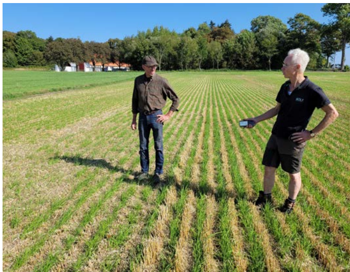
Flot etableret hundegræs efter vårbyg på Fyrendal