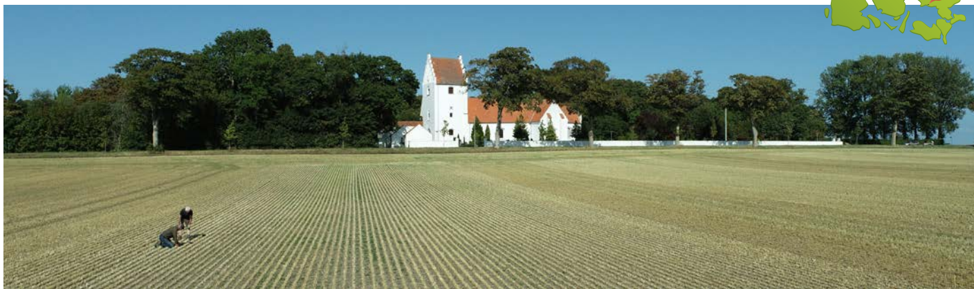
Årets udlæg af hvidkløver har været gnavet noget ned af bladrandbiller, så i nogle områder skal man ned på knæ for at finde planterne. Vi forventer, at marken bliver ok. I baggrunden ser man Fyrendal Kirke, som næsten er bygget sammen med herregården