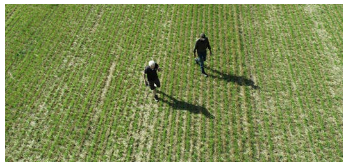
Gennemgang af årets udlæg af hundegræs Sparta udlagt i vårbyg

” 21 tons gravemaskine på bæltet bruges til at læsse kalkunmøg, og det lugter jo lidt, så det er rart med lidt afstand ”