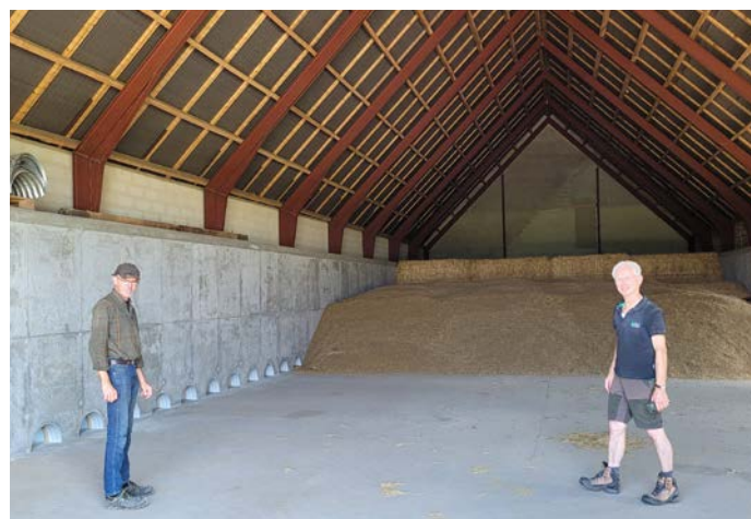
Det nye frøtørringsanlæg fra 2019 er opført i den gamle kostald på ejendommen Fyrendal. Det er nemt og hurtigt at tilgå lageret fra frøavlsmarkerne, der ligger godt placeret rundt om Fyrendal