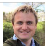
Frøavlkskonsulent Økologi Østjylland