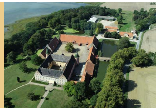
Holsteinborg er placeret i det naturskønne område på Sjællands sydvest kyst, med en flot udsigt over Holsteinborg Nor, Ormø og Glænø. Den østlige ende af parken renoveret i år 2018, hvor der også blev åbnet op for udsigten

“Paa Holsteinborg Juletræet staaer, Med straalende Gaver og Kjærter, Een Green heelt op til Liimfjorden naaer, Med Hilsen fra trofaste Hjerter”.