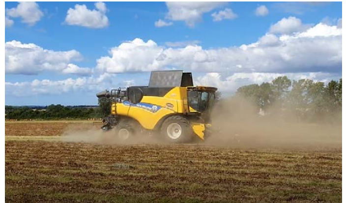
Høst af skårlagt Coolfin hvidkløver i 2020. Udbyttet blev 1065 kg normal kvaliteten pr. ha, hvilket var over det dobbelte af sortens normaludbytte

Bygninger, der ikke anvendes til tørreri og lager, udlejes. Den bynære placering giver gode muligheder for udlejning til erhverv, og samtidig er der altid muligheder for god vinterbeskæftigelse i forbindelse med vedligeholdelsen.