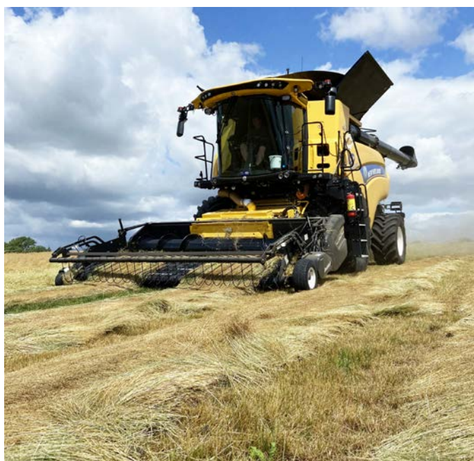
Høst af skårlagt engrapgræs Borsala den 6. juli 2022