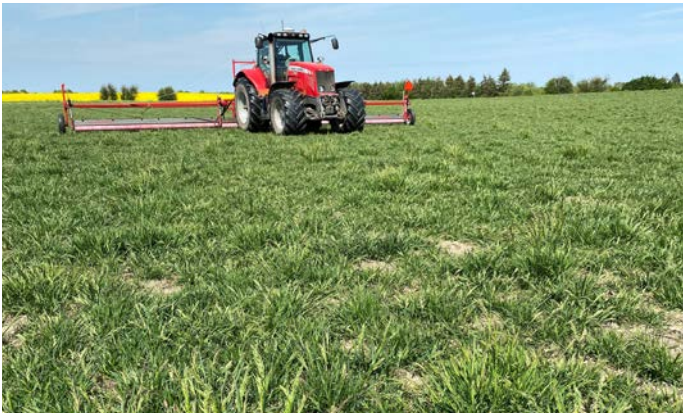
Weedwiperen på arbejde i engrapgræs mod ukrudtsgræsser og høje afvigende typer