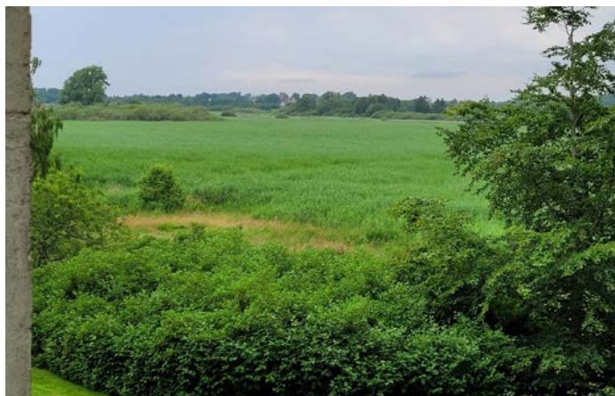
Udsigt over Gundsømagle mose, hvor der bliver høstet tagrør

”Jeg er klar til at betale lidt mere for udsæden, hvis den har en renhed på minimum 99,5 pct. og uden frø af andre plantearter. Det burde være en forholdsvis overkommelig opgave at rense kornudsæden bedre op,” mener han.