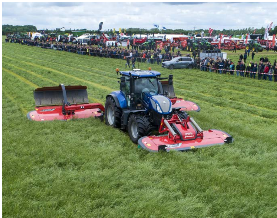
De mange græsmaskiner tiltrak sig stor opmærksomhed fra de omkring 6.000 besøgende

At være en del af hele dette arrangement og se den entusiasme alle vores medarbejdere ligger for dagen, føle landmændene helt tæt på og mærke deres interesse for Seeds and Science – det er en fantastisk følelse. 🌱