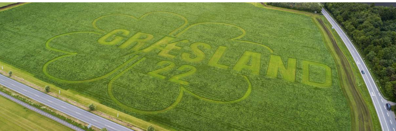
De forbigående ovenfra fik lov at se dette logo for Græsland 22

Flotte græsparceller, duften af nyslået græs og brummen fra de nyeste græsmaskiner var rammen om Græsland 22 i Frederiks ved Karup. Arrangementet, som DLF var medarrangør af, samlede 6.000 græs-interesserede tilskuere, der kunne se det ypperste grej til at slå, snitte og opsamle græsfoderet