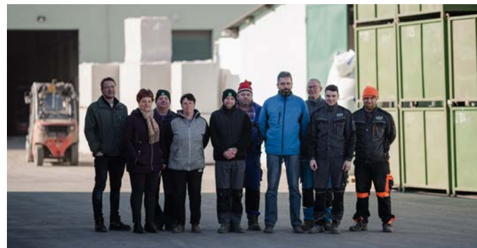
Lagerteamet foran renseshallen

Afdelingen i Životice har to renselinjer og to blandeanlæg til fremstilling af frøblandinger samt to tørrerier, der henholdsvis er ejet og lejet. I øjeblikket renser vi op mod 1.500 t og laver omkring 1.000 t blandinger på årsbasis. De sidste 1.000 t af vores produktion bliver lønrenset hos en tredjepart.