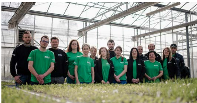
Planteformodlingsteamet i drivhuset med græsplanter i forgrunden

Vores tre planteformodlere i Tjekkiet fokuserer på foderarter af græs og kløver. Velkendte sorter som westerwoldisk rajgræs Jivet, strandsvingel Kora, rajsvingel Perseus samt rødkløver Vesna og Callisto er udviklet på stationen. Med et forædlingsareal på næsten 90 hektar er forædlingsteamet travlt beskæftiget i løbet af året. Der er et sær-