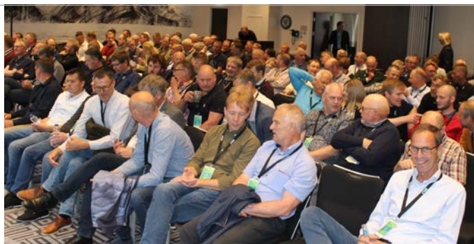
En veloplagt forsamling af delegerede på plads ved delegeretmødet i Edinburgh

der ligger tæt på Edinburgh. Afdelingen, der er på 4.000 m 2 lager samt 400 m 2 kontor var oprindeligt et kølelager, der blev bygget i 70-erne og opkøbt af DLF for 10 år siden. Den nærmeste nabo er et gigantisk whisky-lager, der afgiver nogle dampe, den såkaldte "Angels share", hvor sorte skimmelsvampe stortrives. Det betyder at facaden regelmæssigt bliver vasket af, så der er rent og pænt.