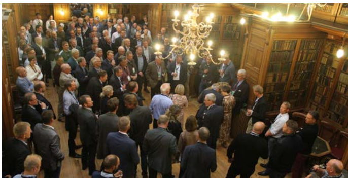
Der var helt "Harry Potters" stemning inden middagen i det smukke bibliotek i Royal College of Physicians

Der er også budgetteret med investeringer i produktion anlæg i USA og Storbritannien.