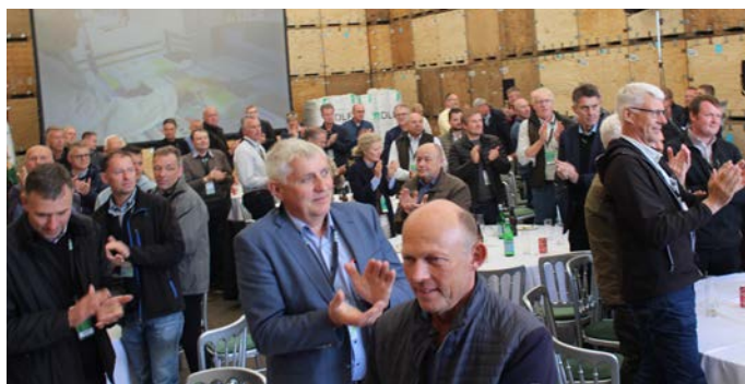
Der var stående bifald fra de delegerede til det britiske team efter et veltillægt besøg