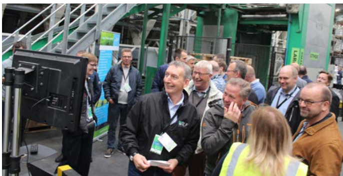
Der var godt humør ved rundvisningen, hvor deltagerne blandt andet fik set det store blande-pakkeanlæg, der består af 48 siloer og er sat op til at kunne aflevere en ny blanding hvert 10.-12. minut

Det var topmotiverede medarbejdere, der tog imod vikingerne fra Danmark, da der var arrangeret besøg på DLF-afdelingen i Broxburn,