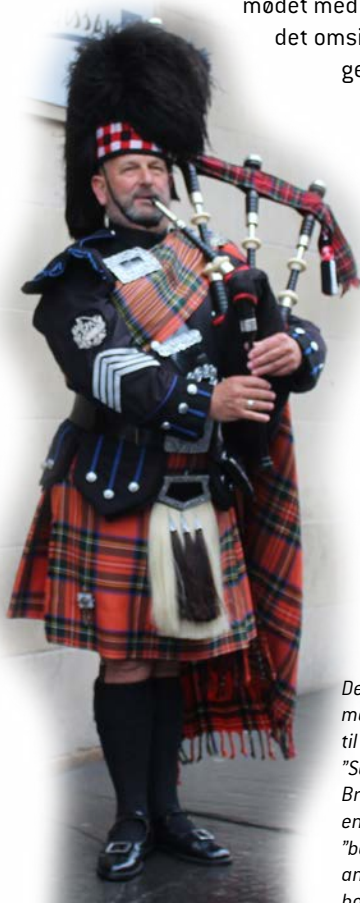
Deltagerne blev mødt velkommen til tonerne af "Scotland the Brave" spillet af en statelig "bagpiper" ved ankomsten til hotellet

DLF har et stort høstareal i Danmark i 2022, og i takt med at kunderne efterspørger en stigende andel af færdigproducerede varer, er der behov for at investere i produktionsapparatet for at kunne imødekomme kundernes ønsker. Derfor vil vi i de kommende år investere i nye teknologiske løsninger, der kan øge kapaciteten og sænke omkostningerne, så vi også fremover kan sikre attraktive danske arbejdspladser.