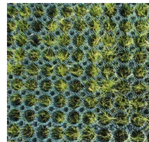
Græsset gror op gennem ski-måtterne og giver bakken et naturligt look

Skiløberne laver et naturligt slid på græsset. Når det er nødvendigt sørger en Flymo plæneklipper for græsklipningen. 🌱